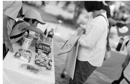
JAS マーク探しの様子