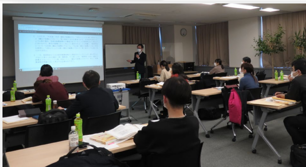
▲過去のセミナーの様子