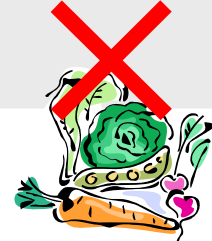
非対象品目：農産物