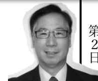
↑ 池亀公和氏 日本獣医生命科学大学 客員教授 食品衛生コンサルタント