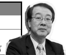
↑ 池戸重信氏 前内閣府消費者委員会食 品表示部会委員。食品表 示関係の著書も多数。